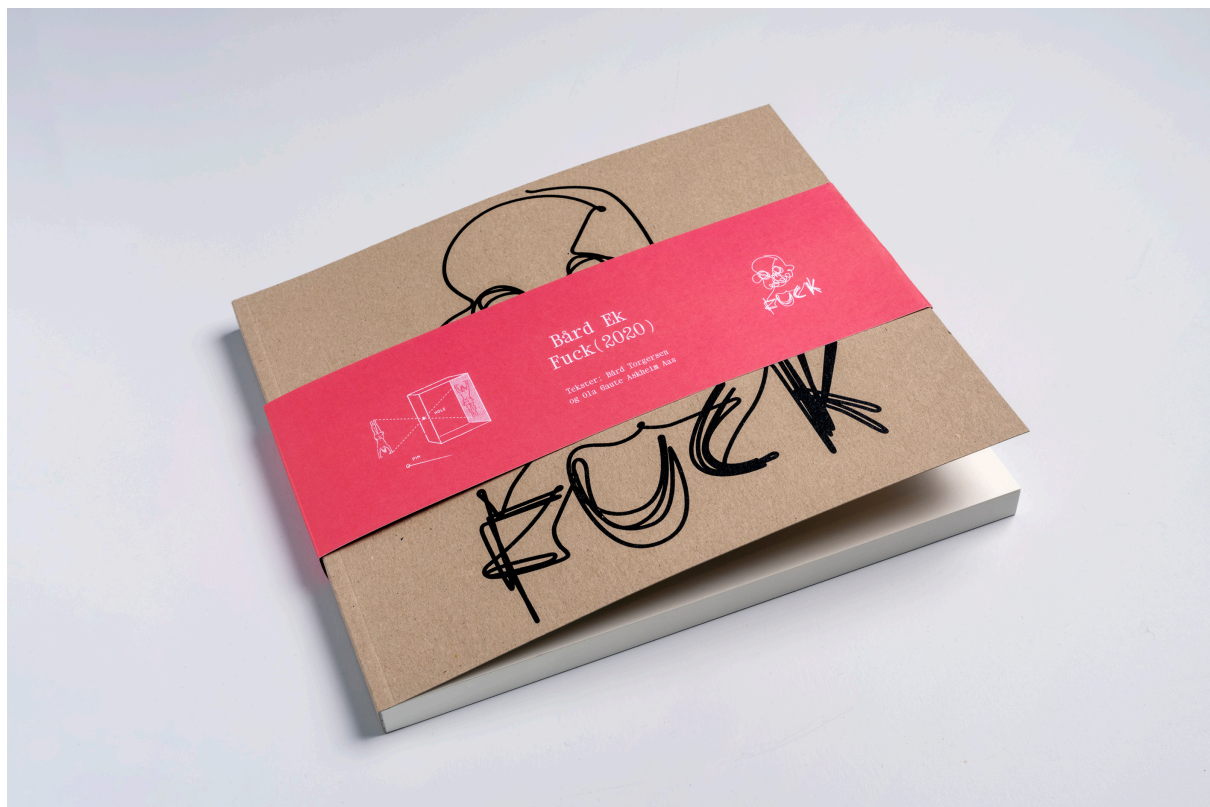
'Fuck 2020' av Bård Ek